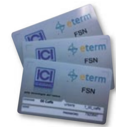
Chiave di accesso personalizzata per ogni unità.